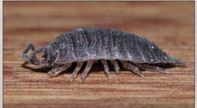
De gewone of ruwe pissebed, de poten zijn hier goed te zien

Een pissebed heeft 7 paar poten, onder elk lichaamssegment zit een paar. Probeer maar eens naar de pootjes te kijken als je een pissebed ziet lopen, de pootjes gaan met een ongelooflijke snelheid. Heel leuk om te zien.