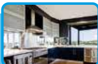
Onderhoud en reparaties

ACTIE! 3 Rookmelders + Installatie Vanaf € 95,- !*