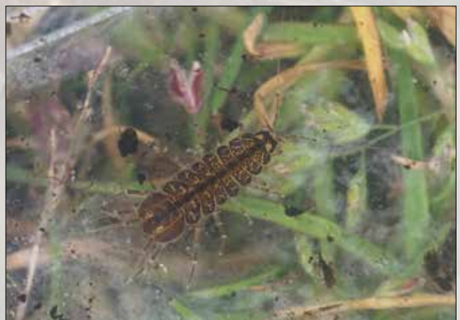
De zoetwaterpissebed, een algemene soort in Nederland

Goed om te weten, dus laat ze gerust hun gang gaan in de tuin!