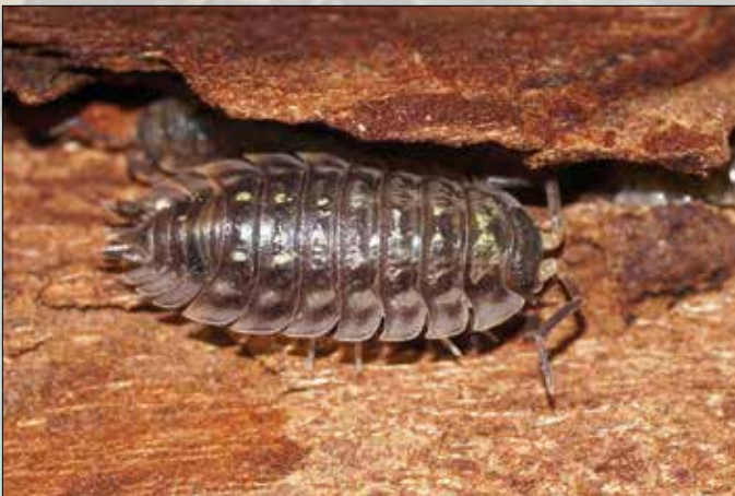
Een kelderpissebed op boomschors

Ondanks dat ze op het land kunnen overleven hebben ze geen longen maar kieuwen, net als vissen. Daarom treft je ze ook altijd aan in een vochtige omgeving. Onder stenen, onder boomschors etc. Je hoeft maar een bloempot te verplaatsen en geheid dat er een groep pissebedden tevoorschijn komt. Ze hebben een vochtige plek nodig om te kunnen ademen, ze houden beslist niet van droge plekjes want daar overleven ze niet. Ze zijn 's nachts actief.