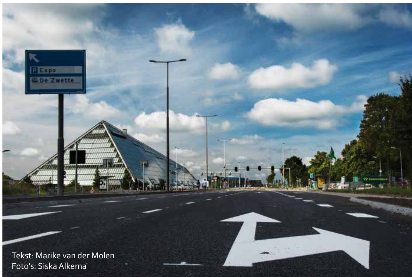
Tekst: Marike van der Molen

'De gemeente communiceert met de commissie Leefomgeving met betrekking tot de verdere werkzaamheden en andere aanpassingen. Als je uitgaat van het principe dat alles staat en valt met snelheid, dan hebben we voor Westeinde een mooie stap gezet met maatregelen die de snelheid verminderen.'